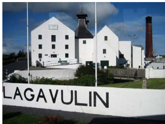
I väntan på transport till destilleriet och festligheter Som denna gången var i Lagavulin

Vi kan varmt rekommendera ett deltagande i "Classic Malt Cruise" som bjuder på storslagna natur- och seglingsupplevelser, mycket bra arrangemang vid destillerierna och många trevliga möten med människor från olika länder. Att det sedan "kryddas" med trevliga upplevelser mellan arrangemangen gör det inte sämre!