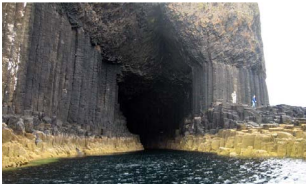
Fingals Cave, en av grottorna på Staffa