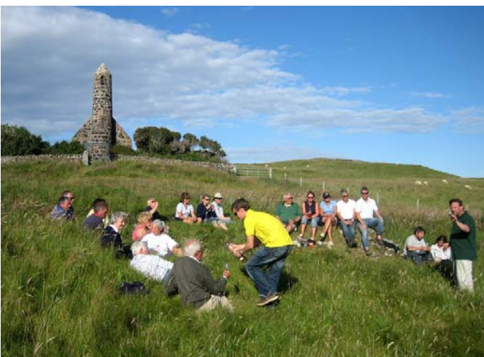
Annorlunda whiskeyprovning i gröngräset

Härifrån gick vi söderut för gennaker ner till ön Canna där vi hade turen att ankra upp i perfekt tid för att delta i "nosing and tasting", dvs whiskeyprovning arrangerad av besättningen på Spray of White. En av resans absoluta höjdpunkter! En helt fantastisk upplevelse att i strålände väder sitta på en grässlätt nedanför en liten vacker stenkyrka och prova olika whiskysorter under ledning av ett proffs. Inte blev det sämre av att man serverade mörk choklad, kex med gravad lax och kex med mögelost till de olika sorterna!