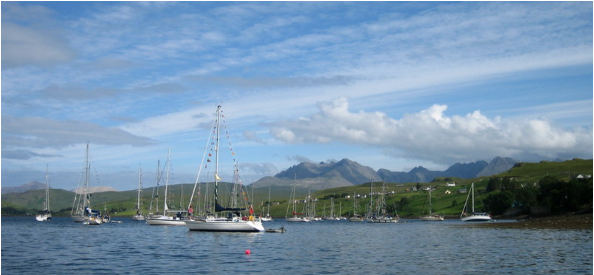
Ankarviken vid Talisker, kolla in båten till höger - tänkte inte på tidvattnet! Skyes mäktiga berg i bakgrunden

På väg upp efter Skyes västsida fick vi rejält med vind för första gången och gjorde stundtals 7 knop och till kvällen kom vi fram till "Loch Harport" och Talisker. Här låg alla båtar uppankrade och det var tätt mellan dem! Mäktig syn då alla hade flaggspel uppe.