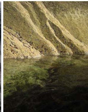
Inne i Fingals Cave