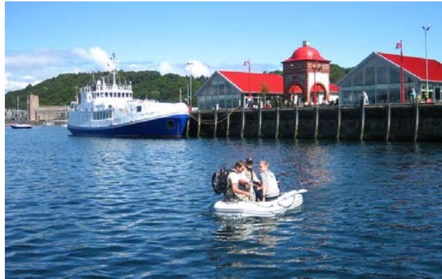
Transport från järnvägsstation ut till båten som låg förtöjd vid mooring-boj