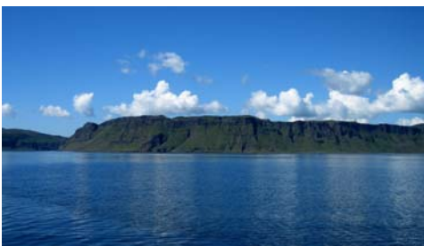
Mulls sydsida, helt obebyggd & öde

Vi satte segel och styrde mot sydväst efter Mulls sydsida, där vi ankrade upp i en vik. Tittade på de ankarvikar vi fått tips om, "Tinkers Hole" och "Bull Hole", men vinden var inte rätt. Antagligen är vi lite bortskämda från vår svenska västkust för vi tyckte inte att de var så fantastiska som man hade påstått.