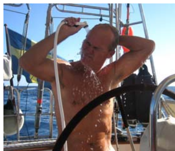
En dusch är aldrig fel