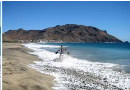
Det är lätt att bli blöt!

En dag åkte vi buss till öns sydvästsida, till lilla samhället Sao Pedro, där man byggt en fin hotellanläggning, Foya Branca, med pooler strax intill det skummande havet. Varje söndag serveras här buffé och vad vi förstår är det väldigt populärt. Restaurangen var i alla fall helt full den dagen vi var där och maten var mycket god. Här fanns en del turister men det verkade även som om lokalbefolkningen uppskattade detta. Måltiden avslutade vi med en välbehövlig promenad i vattenbrynet på den långa stranden.