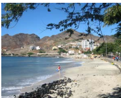
Badstranden i Mindelo

En dag åkte vi buss till öns sydvästsida, till lilla samhället Sao Pedro, där man byggt en fin hotellanläggning, Foya Branca, med pooler strax intill det skummande havet. Varje söndag serveras här buffé och vad vi förstår är det väldigt populärt. Restaurangen var i alla fall helt full den dagen vi var där och maten var mycket god. Här fanns en del turister men det verkade även som om lokalbefolkningen uppskattade detta. Måltiden avslutade vi med en välbehövlig promenad i vattenbrynet på den långa stranden.