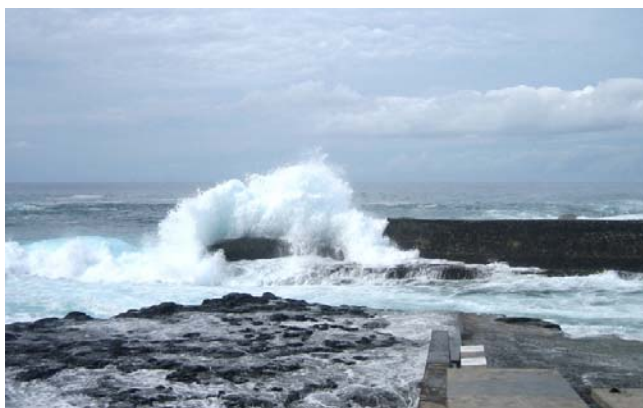
Här slog vågorna in över piren