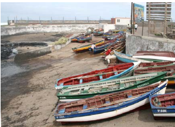
Färgglada båtar vid Ponta do Sol