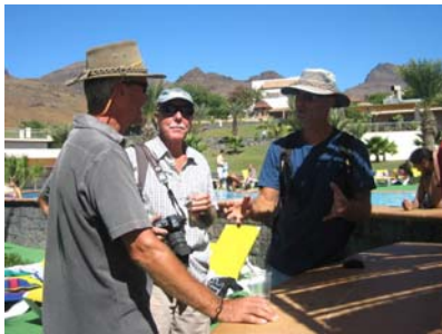
I baren på Foya Braca

Vi flyttade in i marinan och började efterlysa vår dinge, det är ju inte direkt en storstad vi är i. Anmälan gjordes hos marina polisen och man fick lätt känslan av att de ville kolla själva innan en officiell anmälan gjordes. Nu när vi bytt försäkringsbolag, sedan vi lämnade Europa, är vår självrisk mycket högre så vi får ingen ersättning från någon försäkring denna gång. Därför har vi utlovat hittelön om dingen dyker upp. Får se vad som händer.