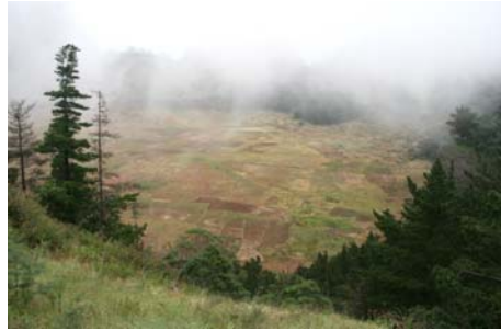
Odlingslotter i kratern vid Cava de Paul