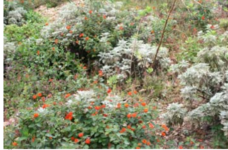
Örter av olika slag