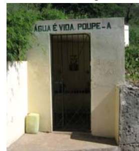
Här kunde man hämta friskt källvatten