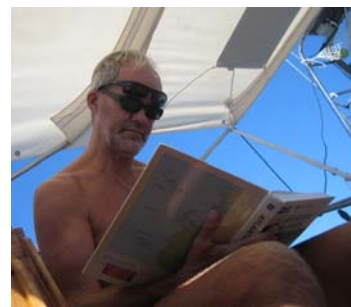
Vi läser om nya platser