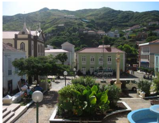
Stora torget i Ribeira Brava

I Ribeira Brava, som gav ett prydligt intryck, strosade vi runt och lunchade innan vi gav oss ut på vandring uppe i bergen som omgav byn. Själva byn ligger längs en dalgång vid foten av nationalparken Monte Gordo med sin högsta topp på över 1 300 meter. Här är grönt och frodigt med blommande trädgårdar längs gator i en charmig röra av olika höjder. Här fanns gott om små butiker och folket såg ut att må bra.