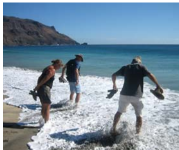
Skönt fotdopp längs stranden