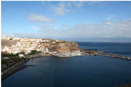
San Sebastian på La Gomera

Sista eftermiddagen var vi laddade, allt var inhandlat och båten fylld med de förnödenheter vi tror att vi kommer att behöva, på listan över saker att göra hade vi kunnat stryka punkt efter punkt och resfebern hade infunnit sig. Nu skulle vi lämna Europa och det kändes klart spännande med allt vi hade framför oss. En sista spansk middag tillsammans med seglarvänner, toppning av tankarna med både vatten och diesel och sedan var allt klart!