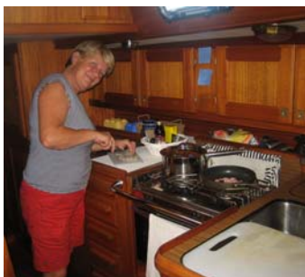
Mat måste man ju ha

Vad gör man då alla dessa timmar som man sitter där på havet? Så här ser våra dagar ut: Under dagarna har vi inga fasta vakter utan är ofta uppe båda två. Det brukar bli så att vi sover någon timma var under förmiddagen och ibland tar någon en lur även på eftermiddagen. Matlagning, att äta och sedan diska tar sin tid varje gång, även om sjön denna gång varit väldigt behaglig. Vi läser en hel del och givetvis skall båten tas om hand.