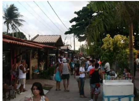
Strandpromenad med butiker

För ca 110 SEK per natt låg vi här och då ingick vatten, el och internet! Vi fick tillgång till en liten pool och här fanns tvätt, bageri och en liten supermarket. Det blev inte sämre när vi till kvällen strosade bort mot yachtklubben och den musik vi hörde. Den kom från en strandpromenad som kantades av restauranger, små hantverksbutiker och ett oändligt folkvimmel. Här kan vi nog trivas! Det visade sig senare att hit åker man för att se på solnedgången. Med floden i fonden går solen vackert ner och speglar sig i vattnet vilken den inte gör på många ställen i Brasilien.