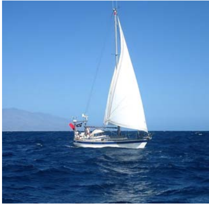
Miss Blue lämnar Kap Verde

2 januari lämnade vi Kap Verde-öarna och fortsatte söderut, även denna gång tillsammans med Kairos och Miss Blue. Vindprognoserna var mycket bra och vi trodde till och med att vi skulle klara av de så kallade "doldrums" utan alltför mycket motorgång.