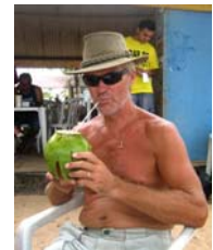
Kokosmjölk svalkar gott

På tåget patrullerade poliser, troligen i avskräckande syfte. Dessa var försedda med batonger men pratade med folk och var vänliga. Annat var det när vi klev av tåget här i Jacaré och såg tre militärpoliserna på motorcykel. Plötsligt tvärvände de och styrde mot en kille på cykel. Innan de var av motorcyklarna hade de dragit pistoler och killen trycktes upp mot en stenvägg. Vi valde att snabbt svänga in på vår gata så vi vet inte hur det hela slutade.