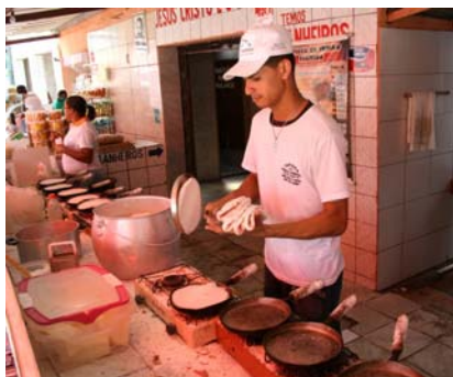
Tapioka, killen sköter 12 pannor!

Marinan ordnade utflykter, bland annat för de franska seglarna i "Les iles du Soleil", men vi var välkomna att följa med. Det gjorde vi en dag och åkte med på en heldagsutflykt in i landet. Det blev ett brokigt sällskap i minibussen, en chaufför som bara pratade portugisiska, en guide/tolk som kunde franska men ogärna pratade engelska, några fransmän och vi, fyra svenskar. Till vår lycka var en av fransyskorna bra på engelska och erbjöd sig på stående fot att översätta åt oss, vilket hon gjorde resten av dagen. Blev lite lustiga situationer när vi besökte olika ställen och visades runt av någon som berättade på portugisiska, vår guide översatte till franska och därefter fick vi en egen översättning till engelska!