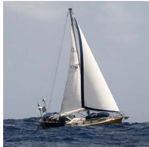
Kairos på Atlanten

Dagen innan vår avsegling var det fullmåne vilket gav oss ljusa, fina nätter i början. Även om vi hade mulet i flera dagar var himlen under natten ljust grå, en enorm skillnad mot de kolsvarta kvällstimmarna.