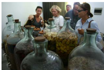
Smaksättning av färska frukter