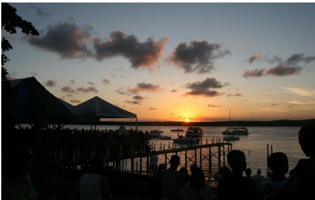
Solnedgång i Jacaré, till tonerna av Ravels Bolero på saxofon