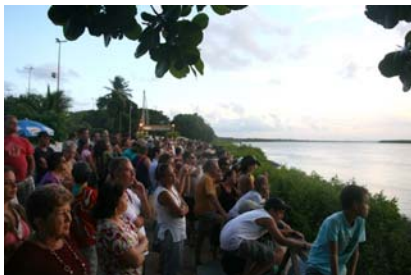
I väntan på solnedgången