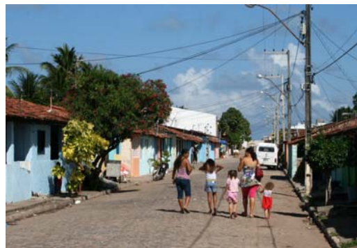
Main Street i lilla Jacaré

Här på södra halvklotet är det sommar nu, semesterperiod och högsäsong är från jul och fram till karnevalen i mitten av februari. Det märks, här är varmt och en helt annan luftfuktighet än vi är vana vid. Temperaturen i vattnet är 30 grader och det är också temperaturen i luften - på natten! På dagarna har vi 5-10 grader till. En svag bris fläktar ofta skönt men vissa nätter står luften still. Tar väl en stund innan man anpassar sig. Det är ju en våldsam kontrast till de rapporter vi får hemifrån, denna den kallaste vintern på 25 år i Sverige, om vi förstått det rätt.