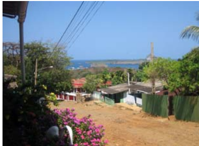
På promenad i byn

Sedan sommaren 2008 kan man som seglare också klarera in i landet här, något som underlättat för de båtar som kommer över Atlanten. Mycket enkel och smidig hantering, med vänlig och hjälpsam personal på plats. Allt gjordes på ett ställe och berörda myndigheter kom helt enkelt dit istället för att vi skulle åka runt!