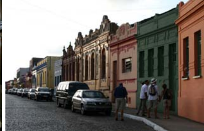
Hus i kolonialstil

Vi besökte ett gammalt, vackert hus som idag var konstmuseum. Här fanns stadens enda murade skorsten så man kunde stoltsera med en öppen spis. Utsikten var förstås fin från dessa höjder. Teatro Minerva, som är en av de äldsta i Brasilien, var också belägen i ett av de gamla husen från kolonialtiden och väl värd ett besök.