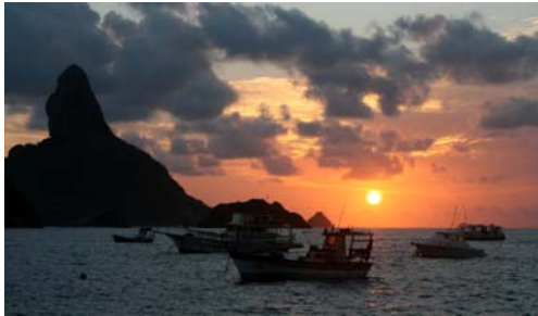
Fernando de Noronha med sin klippa

Efter tolv dagar till havs var det en skön känsla när det dök upp tre gråa knölar borta vid horisonten. Knölarna växte och blev, några timmar senare, till öar vid Fernando de Noronha, ett naturreservat ca 200 Nm utanför nordöstra Brasilien. En ögrupp med 21 öar, där vi bara fick ankra längs en liten kuststräcka på huvudön. Öarna har en lång och brokig historia, men är sedan 1988 nationalpark och idag bor här ca 2 500 personer. Med sitt rika djurliv, kristallklara vatten och fina sandstränder anses det idag vara ett av Brasiliens vackraste resmål och det är hit brasilianarna själva gärna åker på semester.