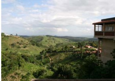
Fin utsikt i Areia

Därefter gick turen brant uppför tills vi kom till den lilla bergsstaderna Areia, med 27 000 invånare, som klättrade längs bergssidan. Här hade man sin storhetstid när flera stora plantager som odlade sockerrör omringade staden.