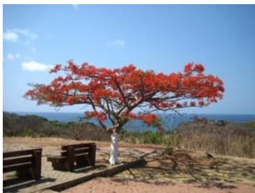
Vanligt träd på öarna

Vi hade tidigare läst både att alla besökare betalar en miljöavgift och att det anses dyrt att komma hit. Hur dyrt fick vi nu veta! Varje person som besöker ön betalar drygt 150 SEK per dag, från dag 2. Det är väl ok, men dessutom fick vi betala en båtavgift på 600 SEK per dag för att ankra utanför hamnen! Så dyra hamnavgifter betalar vi ju inte ens i den finaste marina så man kan inte låta bli att undra om det är så att man inte vill ha hit båtturister. Avgiften är statligt beslutad och inget som man bestämt i den lilla hamnen. Avgiften gällde båtar som var över 10 meter, mindre båtar betalade bara en tredjedel av priset. Ankarplatsen var dessutom utsatt för visst swell så gungigt blev det. Det uppvägdes i viss mån av den fina omgivningen med bland annat sköldpaddor som simmade förbi båten.