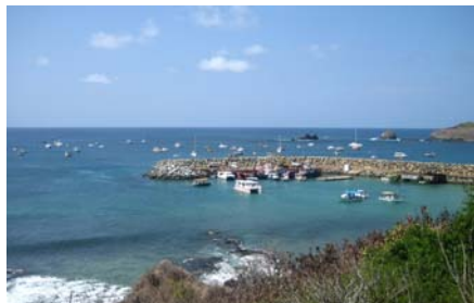
Ankarplatsen, och den lilla hamnen