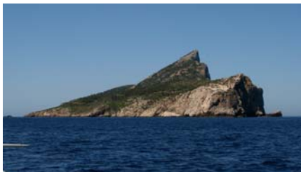
Längs Mallorcas nordvästra kust

Vi gick till Port de Sóller mitt på nordvästsidan. En rund, naturlig vik med hamn och bara en liten öppning ut mot havet. Det är också den enda hamnen på denna långa kuststräcka. Det finns några calor att ankra i men de förutsätter att vädret är ok. Runt viken låg ett par rader bebyggelse och självklart fanns det en lång strand. Fin strandpromenad kunde man också ståta med. Och en liten söt spårvagn! Den gick varje halvtimme längs hela stranden och vidare till byn Sóller, 5 km längre upp i bergen. Gott om restauranger och fina hantverksbutiker kompletterade bilden.