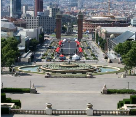
Fontänen under dagtid

Inne på museet snubblade vi på en svensk kille som hade gått El Camino, pilgrimsvandringen till Santiago de Compostela, och nu passade på att besöka Barcelona. Där var ju vi och kikade förra sommaren så vi hade en del att diskutera, både om den delen av Spanien och vad som skulle hinnas med i Barcelona. Tillsammans återvände vi ned till entrén till parken och gick till kvällen upp mot det pampiga konstmuseet framför vilket man till världsutställningen 1929 byggde en vacker fontän, Font Màgica. Vid denna magiska fontän visas några kvällar i veckan ett fantastiskt vattenskådespel ackompanjerat av färg, ljus, rörelse och musik. Mycket vackert!