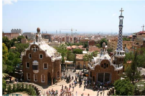
Entrén till Parc Guell

Vi fortsatte istället bussturen förbi bland annat Tibidabo och Nou Camp, Barcas hemmaarena, som för tillfället var stängd då man förberedde en konsert med U2 om ett par dagar. Vid stora torget i centrum, Placa de Catalunya, klev vi av och avslutade med att strosa längs Ramblan ännu en gång.