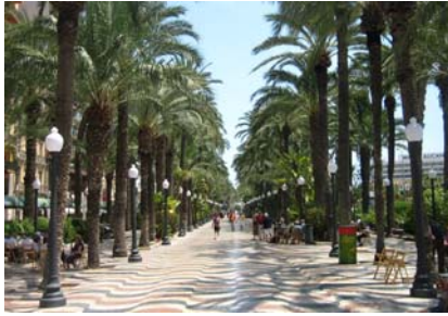
Fin strandpromenad i Alicante