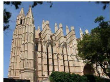
Det fanns förstas en katedral

Våra förutfattade meningar har kommit ordentligt på skam och Mallorca har varit en fin upplevelse. Men nu vinkade vi hejdå till Prima Donna, som fortsatte runt Mallorca, medan vi satte kurs mot Barcelona. 2 timmar kunde vi segla sedan blev det motorgång på ett alldeles platt vatten. Vid ett tillfälle såg vi mindre valar som vältrade sig i vattnet annars var havet tomt detta dygn. Desto livligare båttrafik blev det på morgonen när vi kom till Barcelona som är Spaniens näst största stad med sina 4 miljoner invånare (med förstäder).