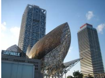
De höga husen vid Port Olímpic

På kvällen den 23 juni började det smattra och smälla från stranden precis bredvid oss. Det visade sig vara Saint Joan, Spaniens svar på midsommar, då man firar sommarsolståndet. Något vi inte var medvetna om och tyvärr missade vi att vara ute och delta i folklivet. Den natten blev det inte mycket sömn, då firandet pågår från solnedgång till soluppgång, med raketer, smällare och eldar som viktigaste ingredienser i firandet.