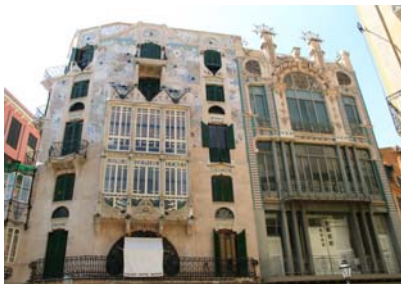
Fint hus i Palma de Mallorca