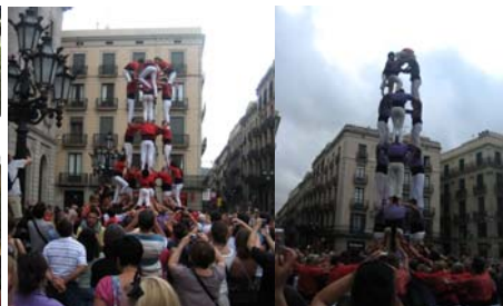
2 lag tävlade i höjd - 7 personer högt!

Promenaden fortsatte längs hela Ramblan, som är den stora huvudgatan. Över 1 km lång och med ett brett mittstråk för de gående. Här finns mängder med olika stånd där man säljer djur, blommor, tavlor och souvenirer samt barer, uppträdanden, gatuförsäljare och folk, folk, folk. Baksidan på medaljen är förstås att allt är väldigt dyrt runt turiststråken. Men ett härligt folkliv som bäst studeras från en stol på någon av alla uteserveringarna. Just denna dag såg vi många som var klädda i rött & gult och viftade med vimplar. Det var en historisk dag med premiär för professionell rugby, Super League, i Spanien! Denna första match gick mellan hemmalaget Catalan Dragons och engelska Warrington Wolfes, vars supportrar gjorde ett gott försök att synas i Barcelona. Hur det gick? Matchen slutade 24-12 till Warrington.