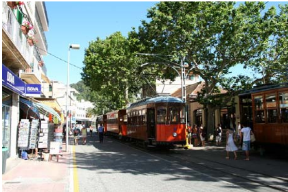
Liten spårvagn i Port de Sóller

Åter en lättvindsslör, dvs 5-8 m/s, tog oss sedan över till Mallorca. Vi har aldrig varit på "Mallis" men hade förstås en massa förutfattade meningar. Vi gick till Santa Ponsa som ligger i sydvästra delen och inte så långt från Palma, som är huvudort. Vi hade hört att där skulle vara fint och vår pilotbok beskrev platsen som pittoresk. Jo hamnen, vid sidan om den stora viken, med omkringliggande bostadsområde var fint men var en s.k. urbanisation där man lever bevakat innanför stängda grindar. Alla aktiviteter fanns längst inne i den stora ankarviken som kantades av höga hotell och där gatorna mest bestod av turist-tingeltangel. Vi stannade bara en natt och istället fortsatte vi norrut, längs västsidan, som är vild och vacker. Höga berg i alla möjliga formationer dominerar, kargt men samtidigt grönt och fullt av små vikar, många med turkost vatten över sand.