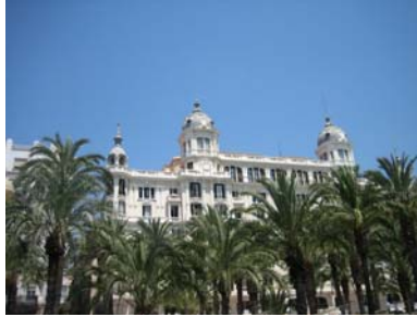
Med fina byggnader...