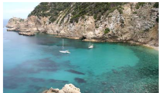
seaQwest för ankar i Clot d'és Llamp

Men med den prisnivån så räcker det med en natt och nästa dag gick vi ännu lite längre norrut och ankrade upp i Cala de San Vicente. En liten ort som bestod av några hotell längs en stor sandstrand och pampiga villor uppe på bergssidan och som sedan följdes av Clot d'és Llamp, en enslig vik omgärdad av otroliga klippformationer. Ankarbotten i dessa vikar var mest av sand så vi låg och njöt i turkosfärgat vykortsvatten.