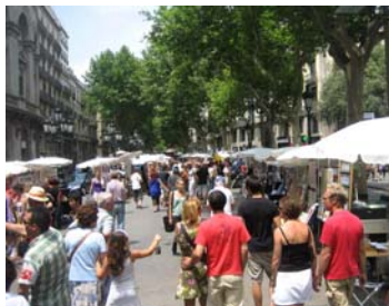
Folkvimmel på Ramblan