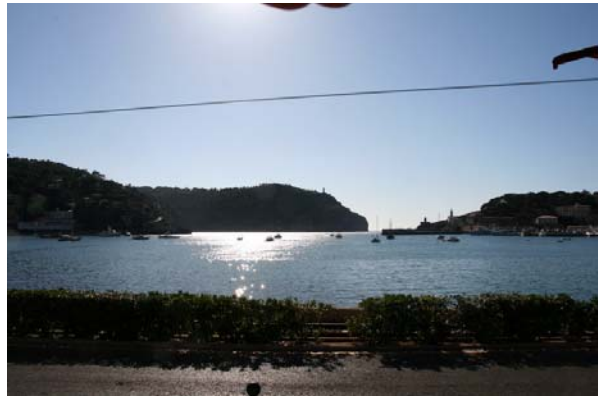
Rund vik med naturlig öppning mot väster

Vi gick till Port de Sóller mitt på nordvästsidan. En rund, naturlig vik med hamn och bara en liten öppning ut mot havet. Det är också den enda hamnen på denna långa kuststräcka. Det finns några calor att ankra i men de förutsätter att vädret är ok. Runt viken låg ett par rader bebyggelse och självklart fanns det en lång strand. Fin strandpromenad kunde man också ståta med. Och en liten söt spårvagn! Den gick varje halvtimme längs hela stranden och vidare till byn Sóller, 5 km längre upp i bergen. Gott om restauranger och fina hantverksbutiker kompletterade bilden.