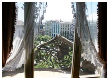
Utsikt över Passeig de Gràcia