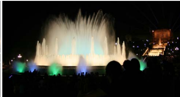
Pampigt skådespel vid Font Màgica under kvällstid

Under tiden har vi också gått igenom alla stuvutrymmen i båten, sett över vad som skall tas med hem, packat ner segel och gummibåt och allmänt förberett för att lämna vår båt. Lite konstigt känns det att åka från det som varit vårt hem i över ett års tid men samtidigt ser vi fram emot att besöka Sverige nu under den finaste tiden och att träffa alla vi saknat. Vi skall ha semester från seglarlivet och dessutom prova på att jobba lite innan vi återvänder. I bästa fall kanske det kan bli någon liten tur i vår svenska skärgård också. 29 juni var det dags för oss att ta bussen till Girona, flygplatsen norr om Barcelona. Det är cirka 10 mil att åka men direktbussen kör dit på dryga timman för 12 € per person. Ryanair tog oss sedan till Göteborg City (Säve) på bara 3 timmar och vi fick ett härligt återseende när inflygningen gick över södra skärgården och vår hemmahamn, Krossholmen. För tillfället var vädret i Göteborg ungefär detsamma som i Barcelona, så det var bara att fortsätta att njuta av värmen.