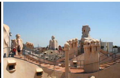
Skorstenarna vaktar på taket