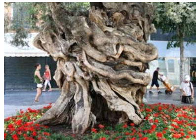
Och gammalt olivträd!