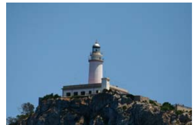
Formentors fyr på norra Mallorca

Längst upp i nordväst rundade vi Formentor som bjuder på hisnande serpentinvägar och dramatiska klippstup. I Cala Formentor träffade vi JRSK-båten Prima Donna så det blev några dagars trevligt umgänge. Liggandes i en stor, fin vik med kristallklart vatten blev det förstås gott om tillfällen till bad under några härliga, varma dagar.