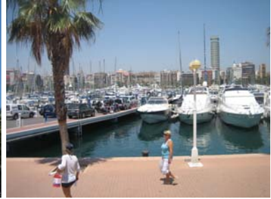
och hamnen mitt i stan!

Det är en genuin stad med många fina byggnader, gator och gränder. Här finns en del att se men jag har varit här förut så vi prioriterade arbete med båten den dag vi låg där.