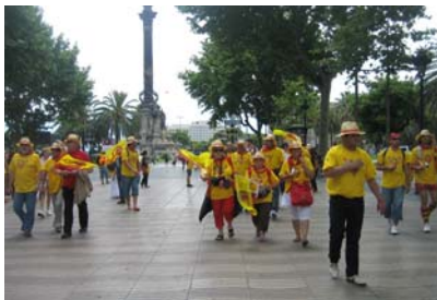
Supportrar till Catalan Dragons

Sedan låg nio dagar framför oss, avsedda till att förbereda för att lämna båten samt att vara turist i Barcelona. Vi kommer ju tillbaka efter sommaren så en del kan vi spara tills dess. Första dagen tänkte vi bara besöka turistbyrån och traskade iväg mot den andra centrala hamnen, Port Vell. Vi gick då genom de gamla arbetarkvarteren Barceloneta, som är ett lite äldre bostadsområde, beläget mellan hamnarna i direkt anslutning till playan, med massor av smala gränder, butiker och barer.