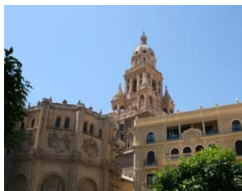
Katedralen från baksidan