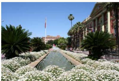
Planteringar finns det gott om