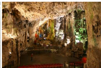
En hel sal - skapad av naturen