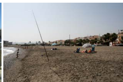
Caleta de Velez

Dessutom drevs hamnen av EPPA så priset var klart tilltalande, 11:50 Euro för våra 36 fot! I Estepona betalade vi 31 Euro, och då är det fortfarande lågsäsong här.