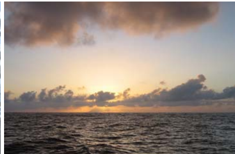
Fina solnedgångar blev det.

Det tog lång tid innan vi kunde lämna Teneriffa för att göra denna segling "mot alla odds" men istället blev allt så mycket bättre än vi väntat oss. Många hade varnat oss för de hårda vindar, oftast motvindar från nordost, och den besvärliga sjö man kunde råka ut för på en resa åt detta hållet. April och maj skulle ändå vara den tid på året som kunde ge bäst förhållanden innan det azoriska högtrycket "parkerat" sig på Atlanten. Nu kom vi istället iväg ganska snart från Porto Santo och kunde rida på framkanten av ett lågtryck som skickade oss österut med bra fart. Vi fick en härlig, snabb översegling som avslutades med en dag för motor i nästan stiltje i ett oftast soligt sommarväder. Atlanten är ju stor så sjö blir det och att man är lite mörbultad efter en översegling är mer regel än undantag. Vi fick efteråt höra talas om en amerikansk båt som gått samtidigt som oss fast från Gibraltar till Porto Santo, något som skall vara enkelt att pricka in när de förhärskande vindarna är nordostliga. Nu fick de problem! Samma lågtryck som förde oss österut hade de gått rakt igenom, så de kom in på Porto Santo med skörade segel.