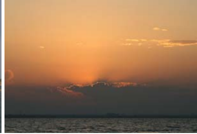
Solnedgång med fantastiskt ljus

Genom en smal kanal gick vi in i Mar Menor, Europas största innanhav, som är 12 Nm långt och 6 Nm brett, dvs drygt 2 x 1 mil, och ca 5-6 meter djupt.