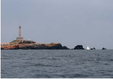
Cabo de Palo med sin fyr