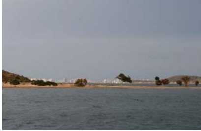
I en ankarvik inne i Mar Menor