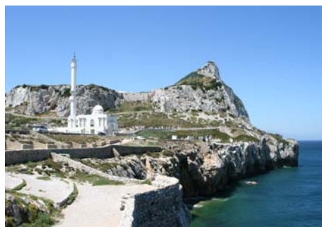
Moské vid Europa Point