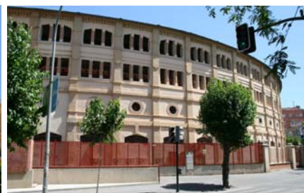
Tjurfäktningsarena i Murcia

Sista dagarna i maj bunkrade vi. Här i Cartagena finns en stor Carrefour-affär och handlar man tillräckligt mycket så får man sina varor hemkörda. För vår del väntar nu ö-liv med ankring så transporter lär ske med gummibåt. Då är det praktiskt att fylla båten innan. Vi hann också med lite umgänge, bland annat födelsedagfirande för tyska grannbåten ombord på en irländsk 57-fotare. Först 30 maj kastade vi loss och fortsatte österut. Vi fick en fin segling förbi Cabo de Palo, troligen vår sista stora udde att passera på ett bra tag.