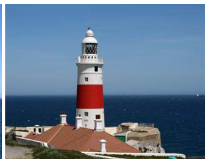
Den fina fyren