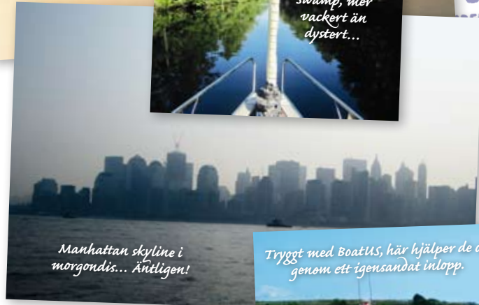
Manhattan skyline i morgondis... Äntligen!