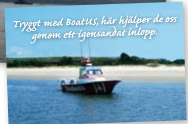
Tryggt med BoatUS, här hjälper de oss genom ett igensändat inlopp.

är det cirka 200 M till New York. Sista delen av ICW är grund, vi valde utsidan. I New York ankrar man bakom Frihetsgudinnan eller ligger på boj vid 79th Street Boat Basin, nära Central Park.