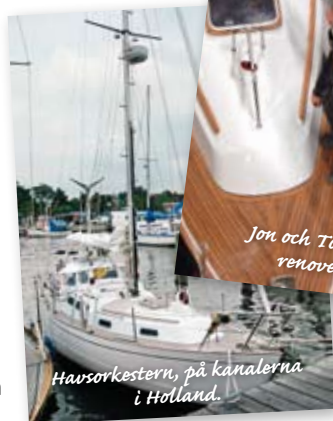
Havsorkestern, på kanalerna i Holland.

Därefter började den stora renoveringen. En idé som killarna genomförde var att beställa tunna vakuumsivor till den kylbox de byggde ombord för att maximera