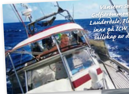
Vänster: SeaQuest korsar Golfströmmen på väg mot Fort Lauderdale, Florida. Höger: Även inne på ICW's kanaler fick vi sällskap av dessa mysiga djur!

Visum är ett absolut måste för att angöra USA i båt! Dyrt men nödvändigt. Går att ordna på vilken ameri-