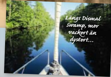
Längs Dismal Swamp, mer vackert än dystert...