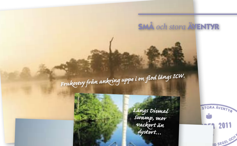
Erukostvy från ankring uppe i en flod längs ICW.

en mörk men spännande färd längs träsket!. I Norfolk hade America's Great Loop Cruisers Association (AGLCA) sitt årliga vårmöte, vi deltog. Bra sätt att lära känna "loopers" och få info om olika delsträckor. Här ska man vara medlem! (Se länkar.) Chesapeake Bay är ett område man kan segla runt i länge. Höjdpunkten var dagarna i Annapolis och en biltur till Washington DC. Man tar C&D-kanal över till Delaware. Sedan