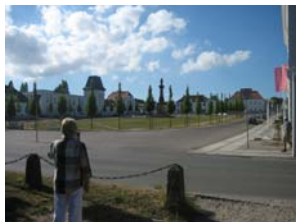
Den vita staden Putbus