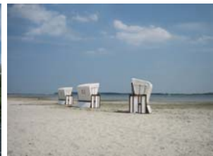
Stranden i Viek

Färden går vidare västerut till Stralsund där vi strålar samman med två båtar från vår hemmahamn (Krossholmen), Cocktail och Vavalangi, för en trevlig middag tillsammans.