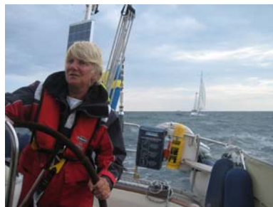
Med vind i seglen