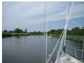
Kanal till Greifswald