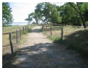
Stigar på Ruden