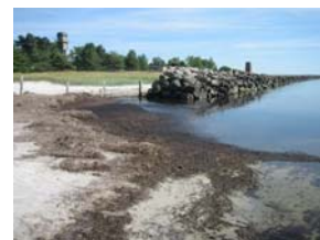
Badplats på Ruden