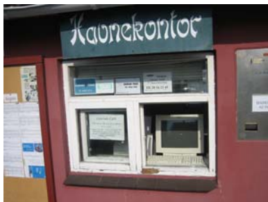
Internetcafé på Samsö

Nu har det äntligen kommit vind så vi går vidare med sikte på Anholt, men nu kommer urladdningen som vi väntat på så länge. Får en rejäl åskskur över oss med vindar upp mot 20 m/s och regn ända in till förpiken. Då vi nästan tappar gummibåten väljer vi att gå in till Grenå. Under kvällen och natten beskådar vi ett rejält åskväder och flera båtar kommer in i hamnen med skörade segel. Vi får nu regn för första gången på flera veckor och tar fram våra täcken till natten!