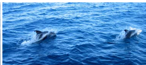
Ja det kan de!