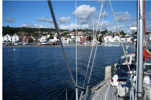
Nya pontonbryggor i Lillesand ger fint skydd

Fortsatte efter sydkusten och nu skulle vi äntligen gå via Blindleja och stanna på något mysigt ställe. Tidigare har vi bara snabbt gått igenom och inte hunnit stanna. Blev inte så denna gång heller, det blåste upp och jag mådde inte bra så till slut hamnade vi i Lillesand. Här har det hänt massor sedan vi var här för ett par år sedan. Nya pontonbryggor som skapade en skyddad hamn gjorde det väldigt trivsamt så här blev vi kvar en dag i ösregn och bläst.