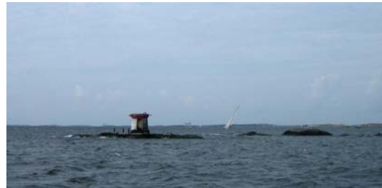
Nästan hemma - vid Skalkorgarna!

Nu ska vi bara byta startbatteri och fixa till de detaljer vi vill förbättra inför vår kommande långsegling nästa år. Men det kommer ju en lång, lång vinter!