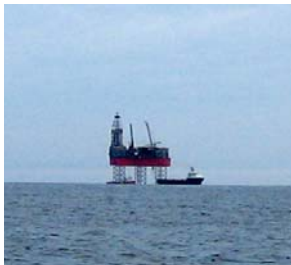
Oljeplattformar finns det gott om på Nordsjön