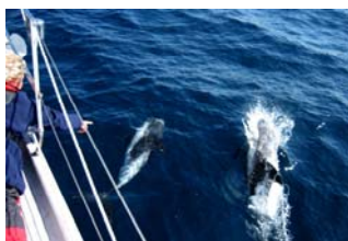
Kan ni hoppa?

Vi hade flera besök av delfiner, bl a ett helt underbart gäng som länge lekte runt båten medan jag låg på fördäck och försökte få dem att hoppa. Det har man ju sett på Kolmården att de kan lära sig! Tyvärr hade jag ingen sill att mata dem med, kanske var det felet.