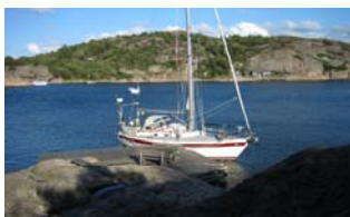
Ny Hellesund, skyddat & mysigt

Hade nu tänkt att ligga still en dag och kanske få kört en maskin med tvätt, vilket knappt blivit gjort på de sex veckor vi varit ute. Det visade sig att säsongen var över i Norge (det var 13 augusti!) och tvättstugan stängde idag. Vi tröttnade snabbt på stadsliv och redan på eftermiddagen gick vi vidare och la oss i en naturhamn.